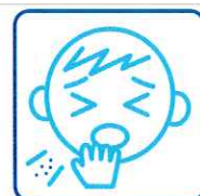
咳・息苦しさのある方