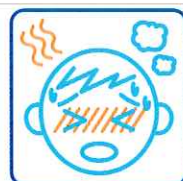
発熱・だるさのある方